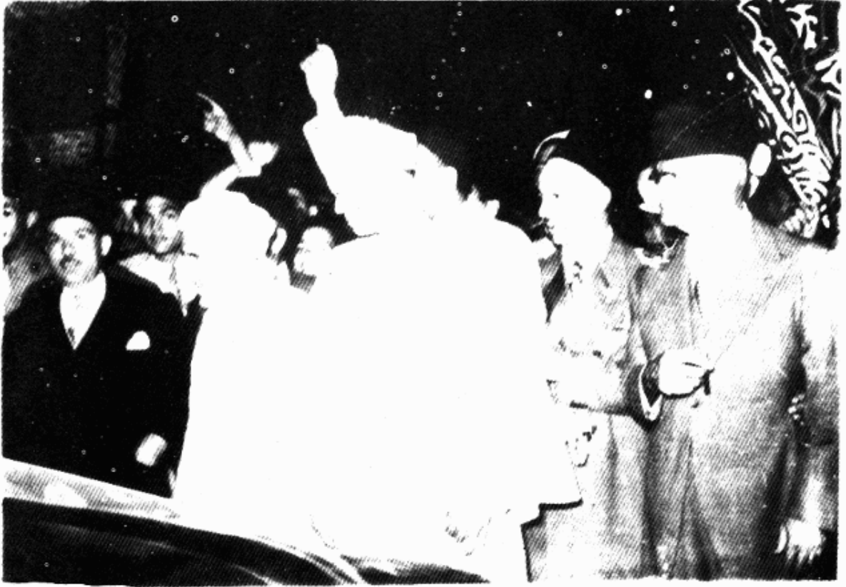
المؤلف يرافق المجاهد محمد بن عبد الكريم الخطاطي إلى السيارة بعد حفلة رسمية.